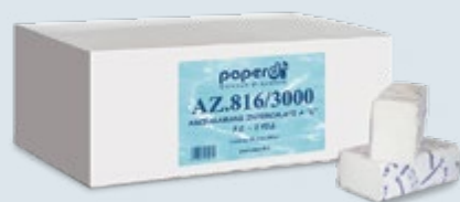
ASCIUG. INTERCALATI a Z Cod. AZ.816/3000