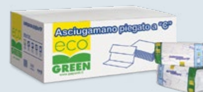
ASCIUGAMANI PIEGATI a C ECO Cod. AC.351