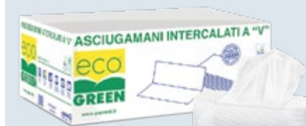
ASCIUG. INTERCALATI a V Cod. AV.11821/5000