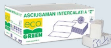
ASCIUG. INTERCALATI a Z Cod. AZ.118/3000