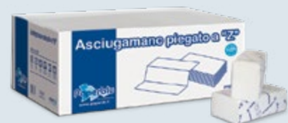
ASCIUG. INTERCALATI a Z SUPER Cod. AZ.802

PRATICI E RESISTENTI PRACTICAL AND RESISTANT