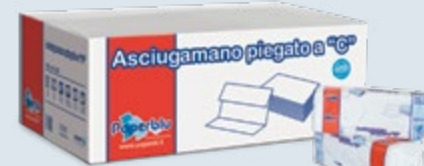
ASCIUGAMANI PIEGATI a C SPECIAL Cod. AC.350