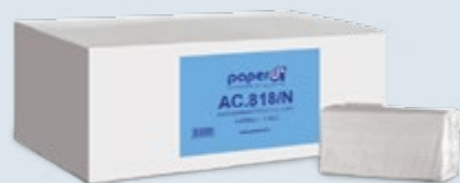
ASCIUGAMANI PIEGATI a C SUPER Cod. AC.818/N