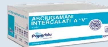
ASCIUG. INTERCALATI a V Cod. AV.81625