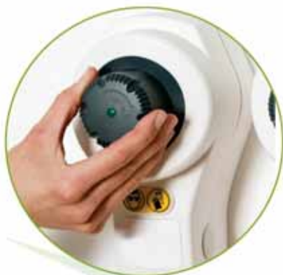
Funzionamento ruota e premi