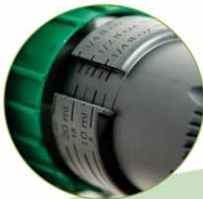
Ghiera verde di dosaggio