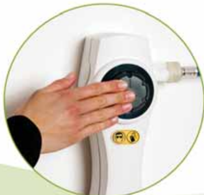
Funzionamento a pressione