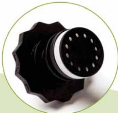
Anello di dosaggio

Punto di servizio diluitori ECOMIX a bassa e ad alta portata.