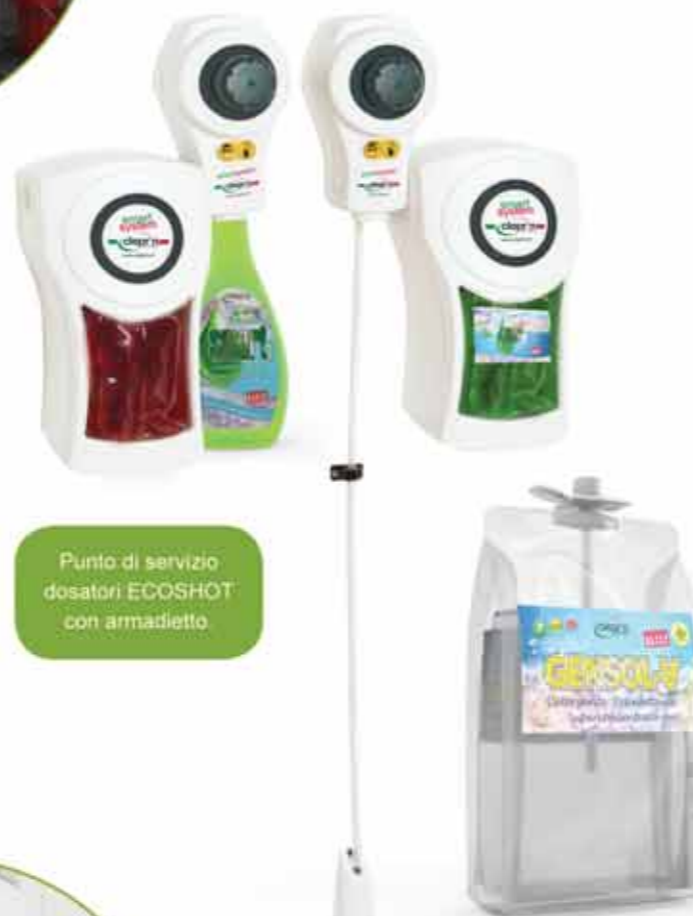
Punto di servizio dosatori ECOSHOT con armadietto